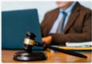
ASESORAMIENTO JURÍDICO LABORAL

Hacé click en cada imagen para ver el detalle o ingresá a nuestro sitio web para ver todo lo que la APGCABA tiene para vos.