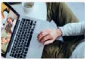
SUPERVISIONES CLÍNICAS Y FORENSES