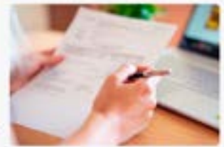
SUBSIDIO POR FALLECIMIENTO DEL AFILIADO/A