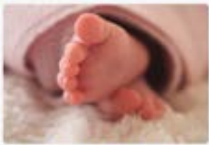
SUBSIDIO POR NACIMIENTO Y/O ADOPCIÓN