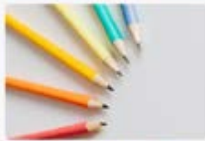
SUBSIDIO POR ESCOLARIDAD PRIMARIA Y JARDIN