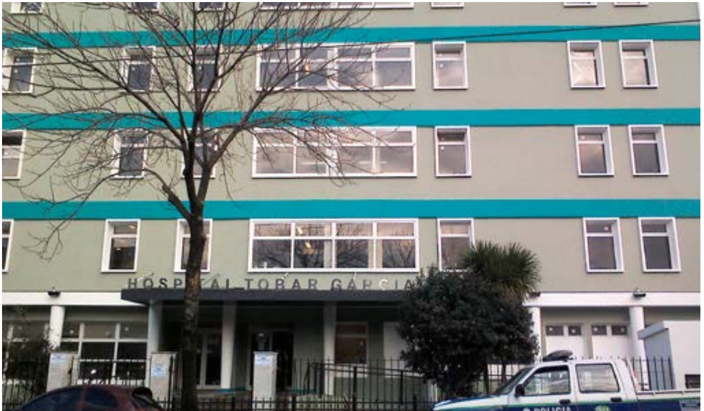
Frente Htal. Tobar García.

permanencia en los lugares sin escabullirse por cada rincón del servicio.