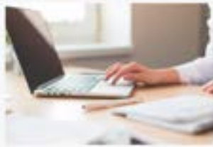
ASESORAMIENTO OBRAS SOCIALES