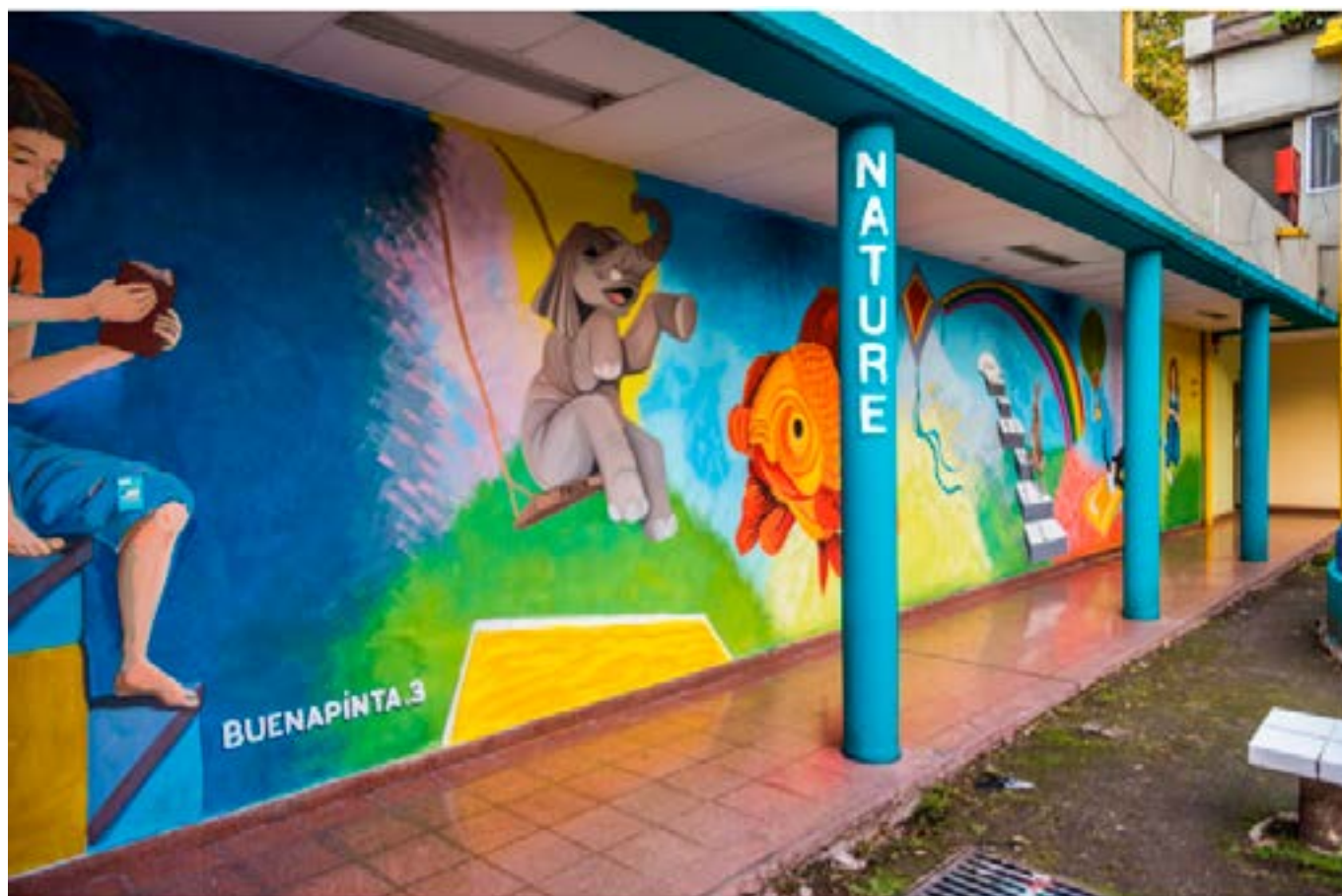
Mural: Nature – 2018 Colectivo Buena Pinta: https://www.facebook.com/buenapinta.3/

frente a situaciones desbordantes e inabordables donde el juego y las palabras como intervenciones, propiciarán hacer soportable lo insoportable.